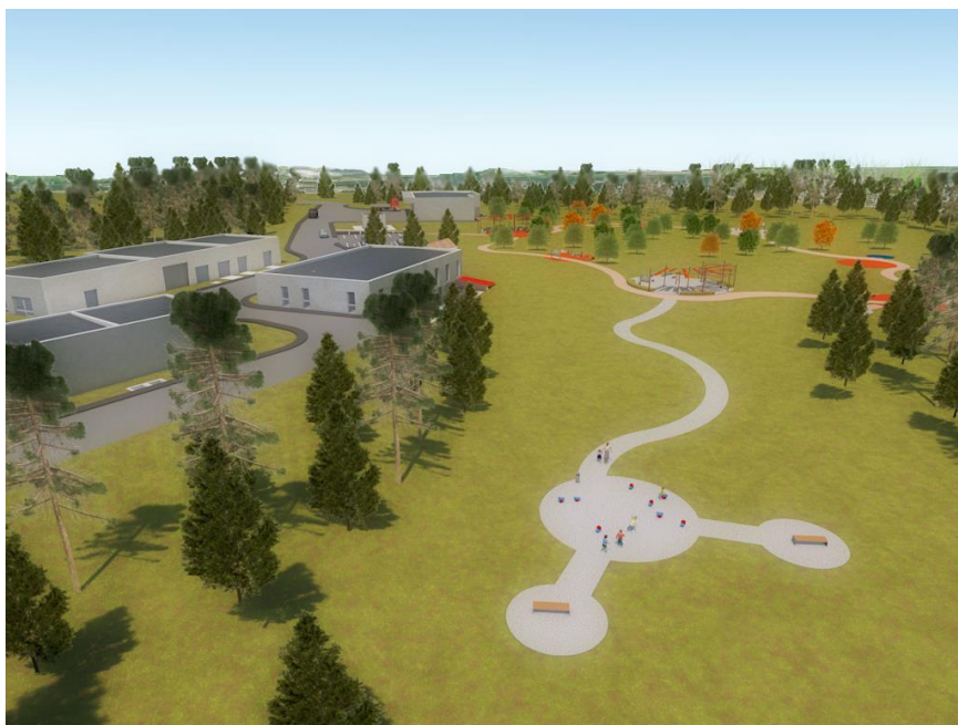
Tematski park Cui

Projekt predviđa ponovnu upotrebu pročišćene vode čime se povećava učinkovitost upravljanje vodnim resursima na području Istre, jer se smanjuje korištenje pitke vode za zalijevanje zelenih površina. Projekt osigurava infrastrukturu za ponovno korištenje pročišćene otpadne vode u takve svrhe na području Rovinja, voda te podizanju stupnja priključenosti stanovništva na sustav odvodnje, čime se doprinosi načelu dobrog upravljanja postojećim vodnim resursima te ispunjenju zahtjeva Europske Direktive o odvodnji i pročišćavanju komunalnih otpadnih voda.