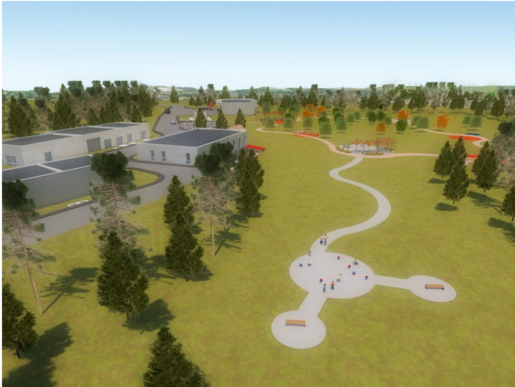
Tematski park Cui

Projekt predviđa ponovnu upotrebu pročišćene vode čime se povećava učinkovitost upravljanje vodnim resursima na području Istre, jer se smanjuje korištenje pitke vode za zalijevanje zelenih površina. Projekt osigurava infrastrukturu za ponovno korištenje pročišćene otpadne vode u takve svrhe na području Rovinja, voda te podizanju stupnja priključenosti stanovništva na sustav odvodnje, čime se doprinosi načelu dobrog upravljanja postojećim vodnim resursima te ispunjenju zahtjeva Europske Direktive o odvodnji i pročišćavanju komunalnih otpadnih voda.